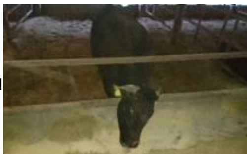
【広々とした余裕のある牛房】