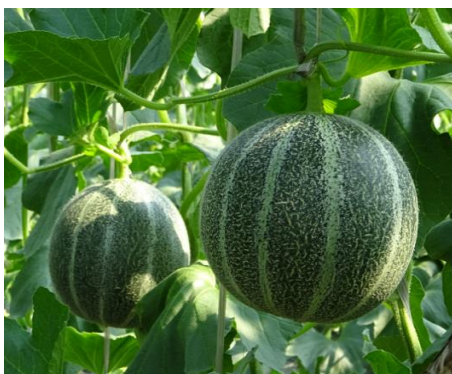
【ハウス内のアムスメロン】

◆出荷は、贈答品やふるさと納税等を含め、島根県内や米子青果を中心に行っています。今後は、温泉津メロンのブランド化、学校給食への提供を含めて地産地消活動にも取り組んでいきます。