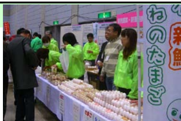
【積極的に販売促進に参加】