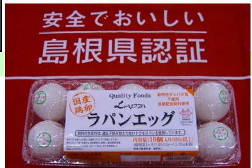
【プライベートブランド ラパンエッグ】