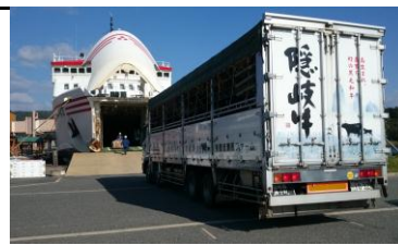
【島からフェリーで出荷】