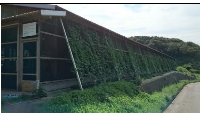
【牛舎にゴーヤを利用した暑さ対策】